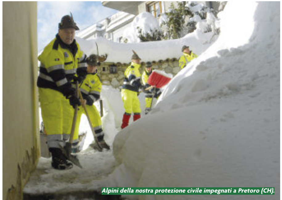
Alpini della nostra protezione civile impegnati a Pretoro (CH).

dalle Sezioni del Nord Italia, mentre altri 50 erano in viaggio per raggiungere la capitale; sempre nella mattinata sono partiti altri 16 volontari alpini al seguito della Colonna Mobile Regione Lombardia. L'11 febbraio è stata ancora rilevante l'attività di soccorso delle squadre ANA di P.C., impegnate nell'emergenza neve: oltre 350 volontari in tutto il territorio della Regione Abruzzo, 115 volontari impegnati a Roma e provincia; 60 volontari in Emilia Romagna, nelle zone di Cesena e Rimini. In queste località dal pomeriggio sono state impegnate le squadre alpinistiche per la rimozione della neve dai tetti. Analoga attività è stata svolta dalle squadre alpinistiche a Fossato di Vico in Umbria. Completa l'operatività la presenza di 36 volontari, divisi in tre turni, impegnati a Torino per l'emergenza freddo. Le squadre dei nostri volontari si sono messe a disposizione delle sale operative regionali che dirigono l'emergenza. Molteplici sono stati gli attestati di riconoscenza che le popolazioni soccorse riconoscono ai nostri volontari. Sui luoghi di soccorso è vivo il sentimento di solidarietà che ci unisce con chi ha bisogno del nostro sostegno materiale. Domenica 12 febbraio si confermano i dati rilevanti della nostra presenza in