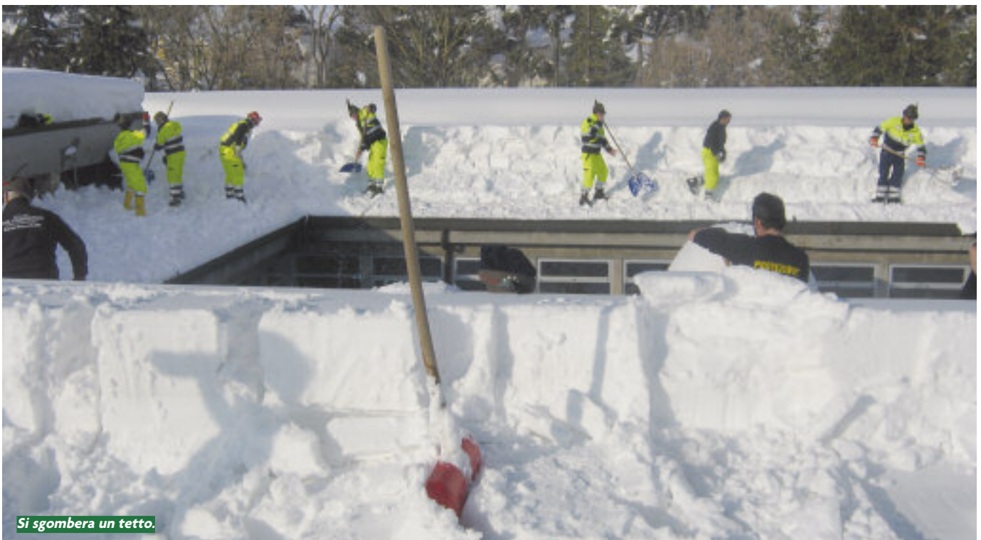
Si sgombera un tetto.

Provincia di Roma, dove le operazioni terminano e i volontari rientrano, ad eccezione di una squadra composta da nove volontari che rientra lunedì 13 febbraio. Lunedì 13 la situazione è la seguente: nella Regione Abruzzo permane l'impiego di 200 volontari; in Emilia Romagna, nella zona di Cesena e Rimini, sono ancora operativi 70 volontari; nelle Marche 45 volontari, operativi principalmente nelle