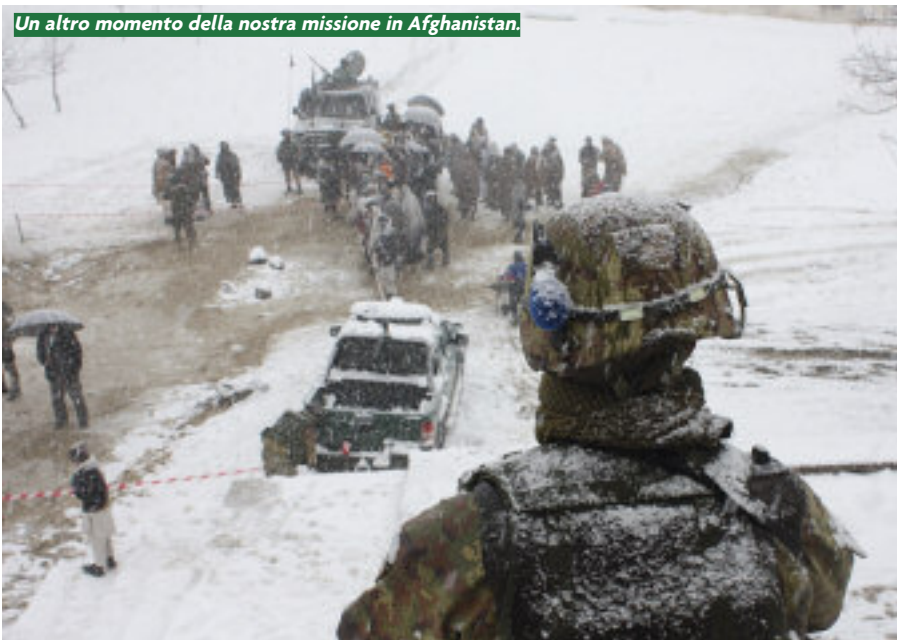
Un altro momento della nostra missione in Afghanistan.

Le precedenti puntate sono state pubblicate a partire da gennaio 2011.