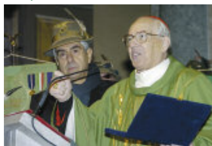
S.E. il cardinale Giovanni Battista Re con il presidente della sezione Bernardi.

Al termine della celebrazione sono stati consegnati tra gli applausi, dal presidente sezionale Bernardi, dal sindaco, dal vice prefetto e da Beppe Parazzini gli attestati di benemerita del Dipartimento della Protezione civile ai tanti volontari di P.C. della sezione di Colico che hanno prestato la loro opera in occasione del terremoto dell'Abruzzo. ●