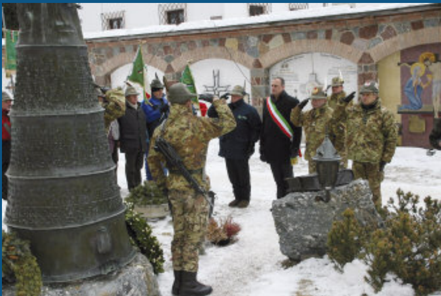
Deposizione della corona al monumento ai Caduti austriaci, nel cimitero di San Candido.

in un ambiente difficile come quello invernale". Sul maxischermo allestito in piazza Magistrato è stato quindi trasmesso il videomessaggio del Capo di Stato Maggiore della Difesa, generale Biagio Abrate, che ha fatto giungere il suo saluto agli alpini, all'organizzazione dei Ca.STA e ai sindaci dell'alta Val Pusteria, sottolineando il valore sportivo, professionale e operativo della manifestazione. Ha dato il benvenuto alle delegazioni dei paesi che spesso si trovano con gli alpini ad operare nelle missioni di pace all'estero ed ha ringraziato gli sponsor per l'aiuto finanziario dato all'organizzazione dei Ca.STA.