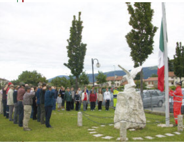
L'alzabandiera ha salutato il nuovo giorno.