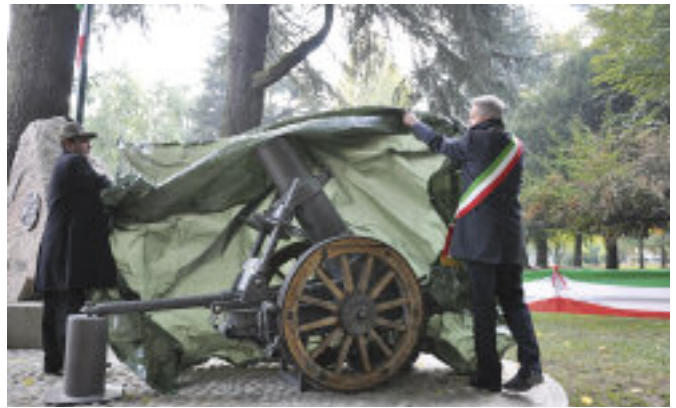
Nelle foto: il gruppo di Lodi e lo scoprimento della vecchia bombarda.

Il Gruppo di Lodi ha compiuto 90 anni e li ha festeggiati con una serie di manifestazioni ripagate dall'affetto e dal calore della gente. La Messa, il sabato nella chiesa di San Gualtiero, ha dato il via alla giornata di celebrazioni. Alla sera presso l'Auditorium della Banca Popolare di Lodi gremito di pubblico, si è tenuta la terza rassegna corale cittadina chiamata "LiberCanto", inserita nei festeggiamenti con la partecipazione del coro dei congedati della brigata