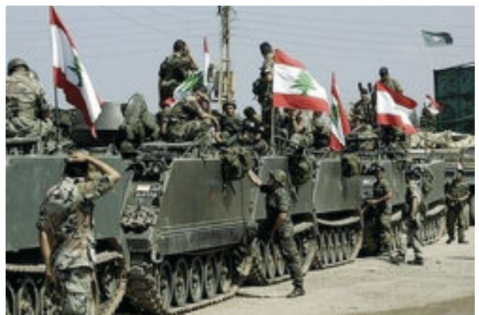
Il reparto corazzato libanese.

Del problema dell'attraversamento, anche involontario, della "Blu Line" e delle conseguenze inimmaginabili di una sconfinamento militare, si è ben consapevoli, così si pensò di delimitare questa linea virtuale disegnata su vecchie mappe che corrispondeva grosso modo ad un confine mai concordato, con dei marcatori ben visibili, realizzati con una base in cemento su cui possano venir innestati piloni metallici culminanti con grossi bidoni colorati in azzurro e contrassegnati dalla scritta UN. L'area a cavaliere della BL è però tuttora da considerarsi come interdetta, sia dai campi minati seminati dai Libanesi, sia dall'effetto "grappolo" delle bombette inesplose prodotte dal fuoco delle artiglierie delle forze israeliane.