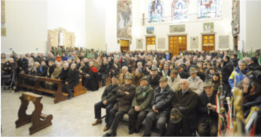
Il Tempio di Cargnacco. In primo piano alcuni reduci.

Al Tempio di Cargnacco celebrata la Messa per gli alpini e per gli altri nostri soldati morti e dispersi nella tragica Campagna di Russia