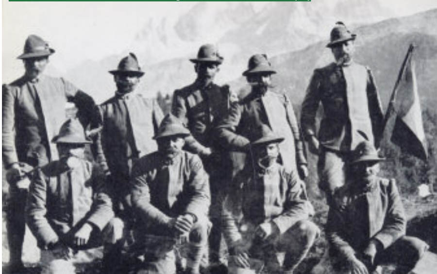
Prima Guerra Mondiale: i "veci" del btg. Val Cordevole a Fuciade (BL)

Quinzio). I termini della riflessione erano chiari: trasformare i reparti alpini in unità adatte al combattimento in pianura, oppure dotarli di versatilità operativa? Le risposte sono state concordi in quest'ultima direzione: "Disponiamo di uno strumento alpino sovradimensionato rispetto alle effettive esigenze di impiego riferite all'ambiente classico e istituzionale - ha scritto il generale Innecco - ma è uno strumento che è bene conservare nella sua interezza perchè depositario di valori che, lungi dall'attenuarsi nel tempo, si alimentano dell'entusiasmo e della tradizione e rappresenta quindi una riserva di valori morali e di capacità operativa che non è lecito alienare".