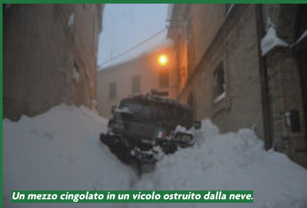
Un mezzo cingolato in un vicolo ostruito dalla neve.

S ono stati circa mille i militari dell'Esercito, Marina e Aeronautica impegnati per l'emergenza neve in varie località d'Italia: da Venezia a Vibo Valentia, passando per le città più colpite di tutta la Penisola. Oltre 200 i mezzi stradali impiegati per ripristinare la viabilità, mentre gli elicotteri han-