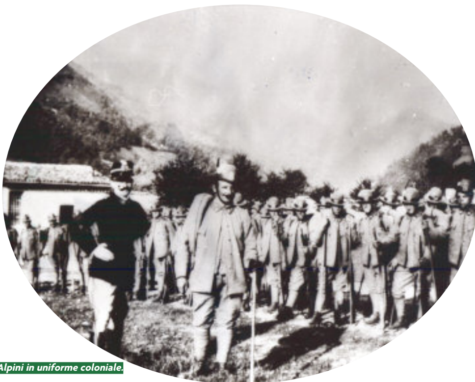
Alpini in uniforme coloniale.