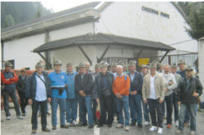
Gli artiglieri della Tridentina di nuovo insieme a Dobbiaco in occasione della commemorazione dello scioglimento del gruppo Asiago.