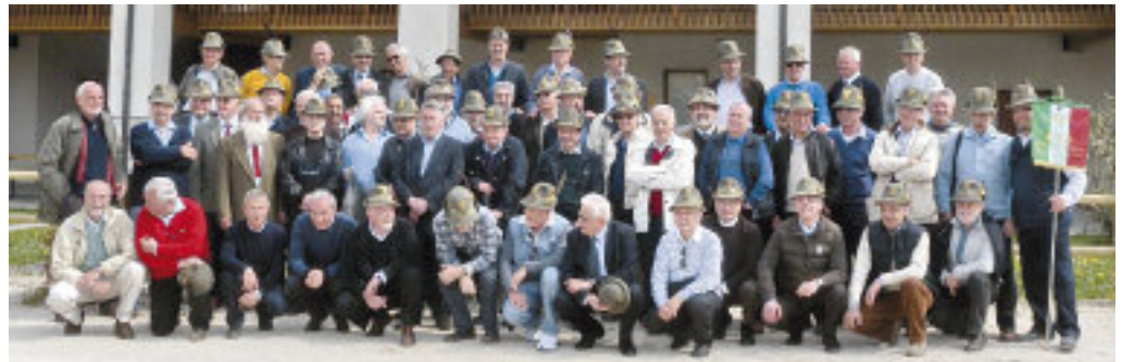
Foto di gruppo degli AUC del 69° corso della SMALP di Aosta (ottobre 1972 – marzo 1973). Per il prossimo incontro programmato per il mese di ottobre ad Aosta, inviare una mail all'indirizzo: titabellini@libero.it