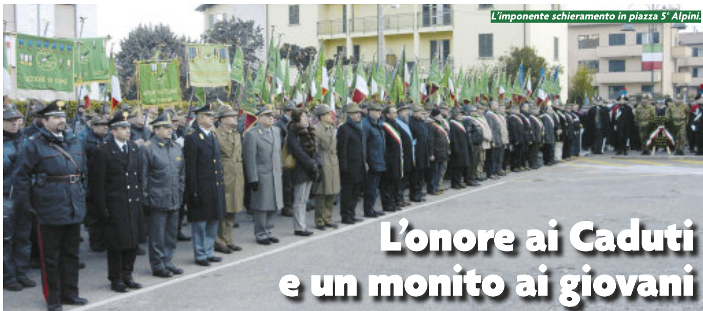
L'imponente schieramento in piazza 5° Alpini.