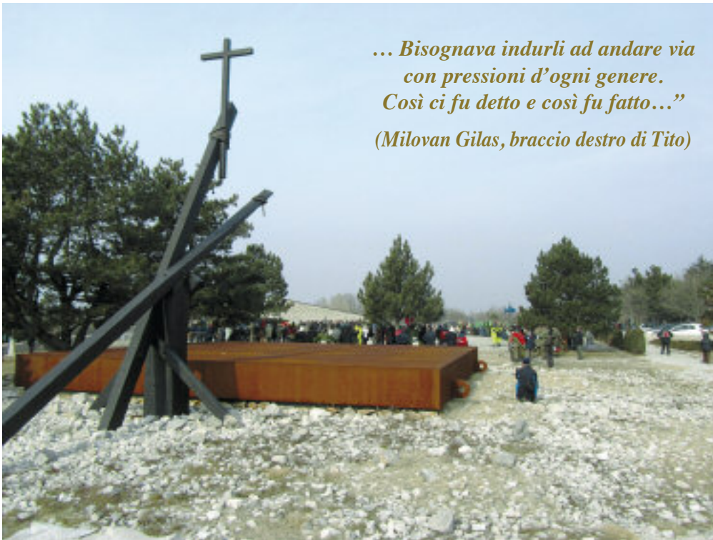
Un momento della commemorazione delle vittime della foiba.

... Bisognava indurli ad andare via con pressioni d'ogni genere. Così ci fu detto e così fu fatto..." (Milovan Gilas, braccio destro di Tito)