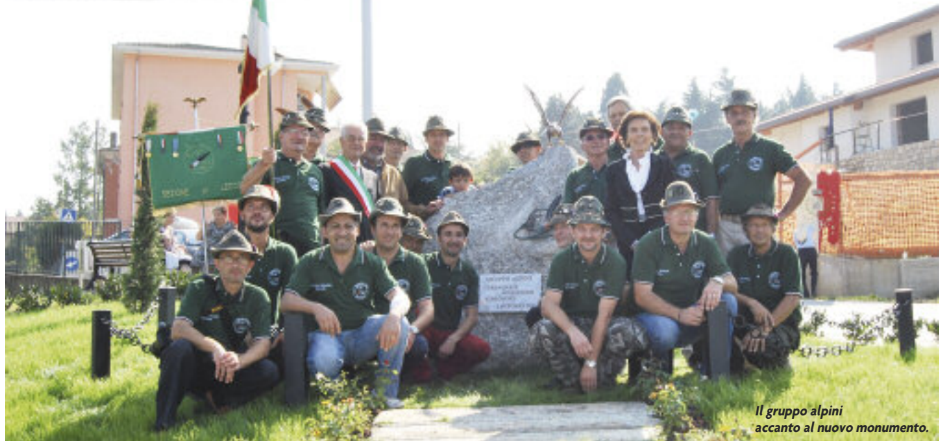
Il gruppo alpini accanto al nuovo monumento.

U na mostra di lavori preparati dagli alunni delle scuole locali per un concorso sui 150 anni dell'Unità d'Italia ha dato l'avvio alla festa per l'inaugurazione del monumento agli Alpini, voluto dal gruppo di Garbagnate Monastero.