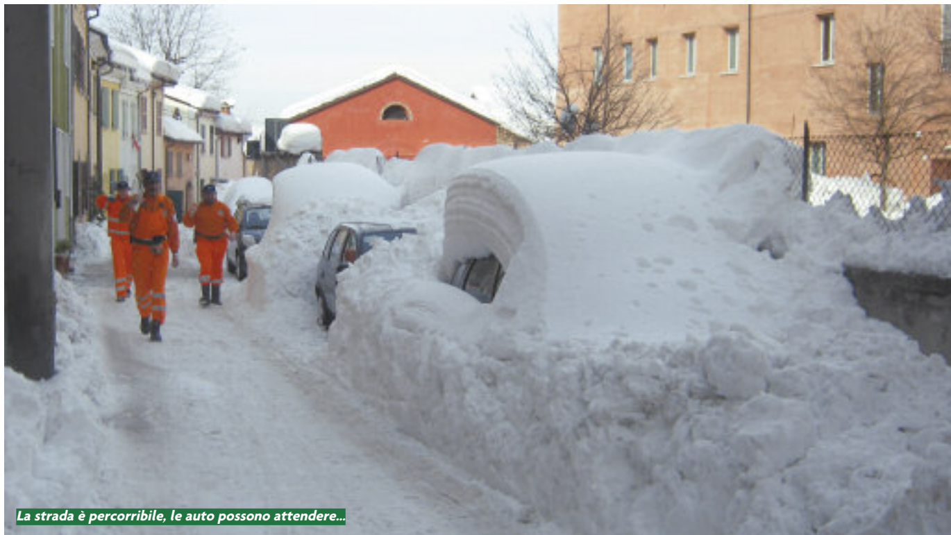
La strada è percorribile, le auto possono attendere...