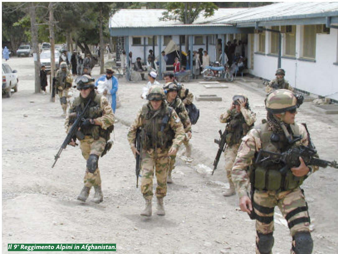
Il 9° Reggimento Alpini in Afghanistan.

La versatilità è così diventata la caratteristica del Corpo, il che ne ha permesso e sollecitato l'impiego operativo nel momento in cui il crollo repentino dell'Impero sovietico e la fine del bipolarismo hanno mutato le esigenze militari. Nel momento in cui l'esplosione di microconflittualità locali ha costretto gli Stati più avanzati a intervenire con missioni di