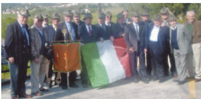
Rimpatriata degli artiglieri da montagna della 38ª batteria, gruppo Pieve, anno 1956.