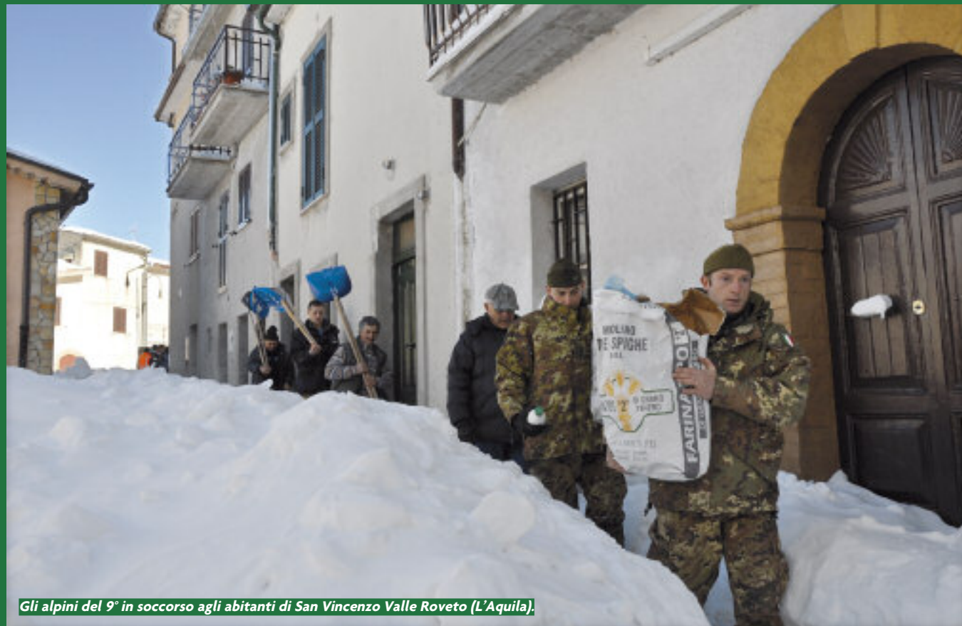
Gli alpini del 9° in soccorso agli abitanti di San Vincenzo Valle Roveto (L'Aquila).

zone di Fano e Pesaro Urbino. Ovviamente le diverse Sezioni hanno anche operato con razionalità e regolarità per sostituire le squadre dei volontari impegnate così duramente sul territorio.