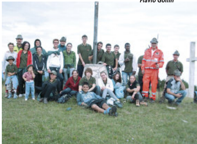
Visi sorridenti e ragazzi felici per l'esperienza vissuta con gli alpini.