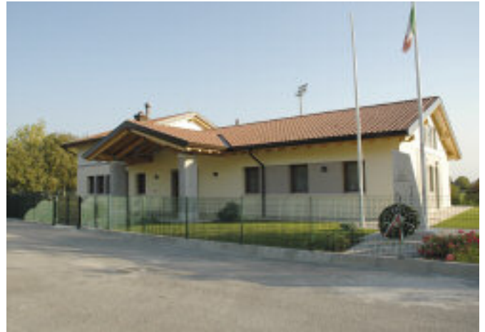
L'elegante e funzionale sede del gruppo di Porcia.

Ariete. La ragione che ha indotto l'inaugurazione congiunta, alpina e aviatoria, è stata la decisione di intitolare la sede alla Medaglia d'Oro al V.M. Luigi Gabelli, ufficiale degli alpini divenuto in seguito pilota dell'Aeronautica. All'interno del recinto della sede è stato collocato un cippo dedicato al ten. Luigi Gabelli recuperato dalle vecchie scuole elementari ora dismesse. Luigi Gabelli, nativo di Porcia, cadde in Etiopia il 26 giugno 1936 assieme all'asso dell'aeronautica magg. Antonio Locatelli, a Lekemti. Con questi presupposti, la manifestazione si è svolta in uno spirito di fraternità che ha coinvolto i numerosi partecipanti. ●