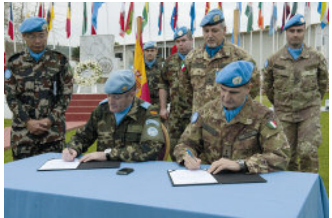
La firma del cambio di comando tra il generale Serra, a destra, e lo spagnolo generale Alberto Asarta Cuevas.

Ma, come detto, l'integrazione può esprimersi solamente se unitamente all'impegno militare è presente un analogo sforzo politico-diplomatico, e che entrambi siano sostenuti da una cospicua componente che miri allo sviluppo anche economico della Regione, e lo staff dell'ONU dispone infatti, all'interno del pro-